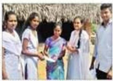
ప్లాస్టిక్ వినియోగంపై కఠిన అవగాహనను వివరిస్తున్న ఎన్ఎస్ఎస్ వలంటీర్లు