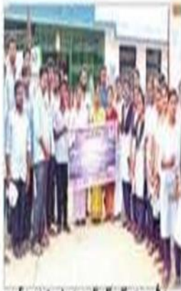
ర్యాలీ నిర్వహిస్తున్న ఎస్ఎస్ఎస్ వలంటీర్లు