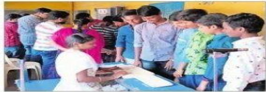
విద్యార్థులకు ప్రయోగాలపై అవగాహన కల్పిస్తున్న అధ్యాపకులు