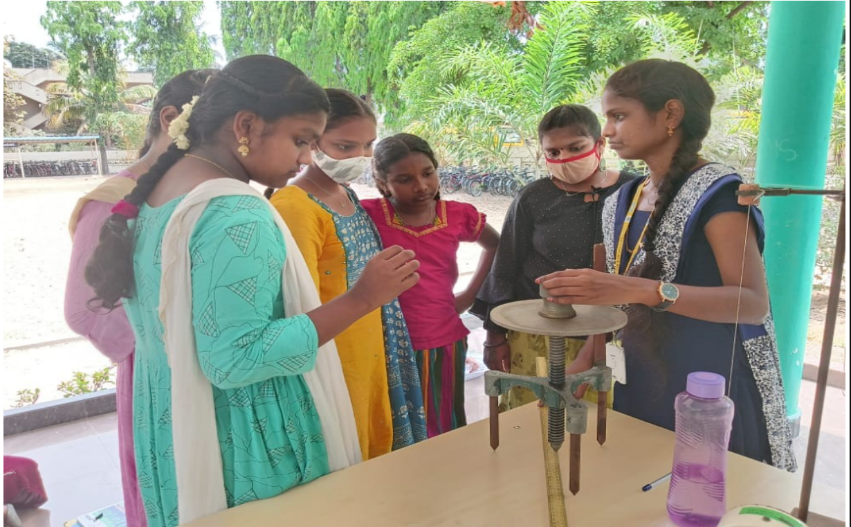
Showing Physics Experiments