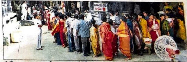
భీమేశ్వరాలయంలో క్యూలైన్లలో వేచిఉన్న భక్తులు