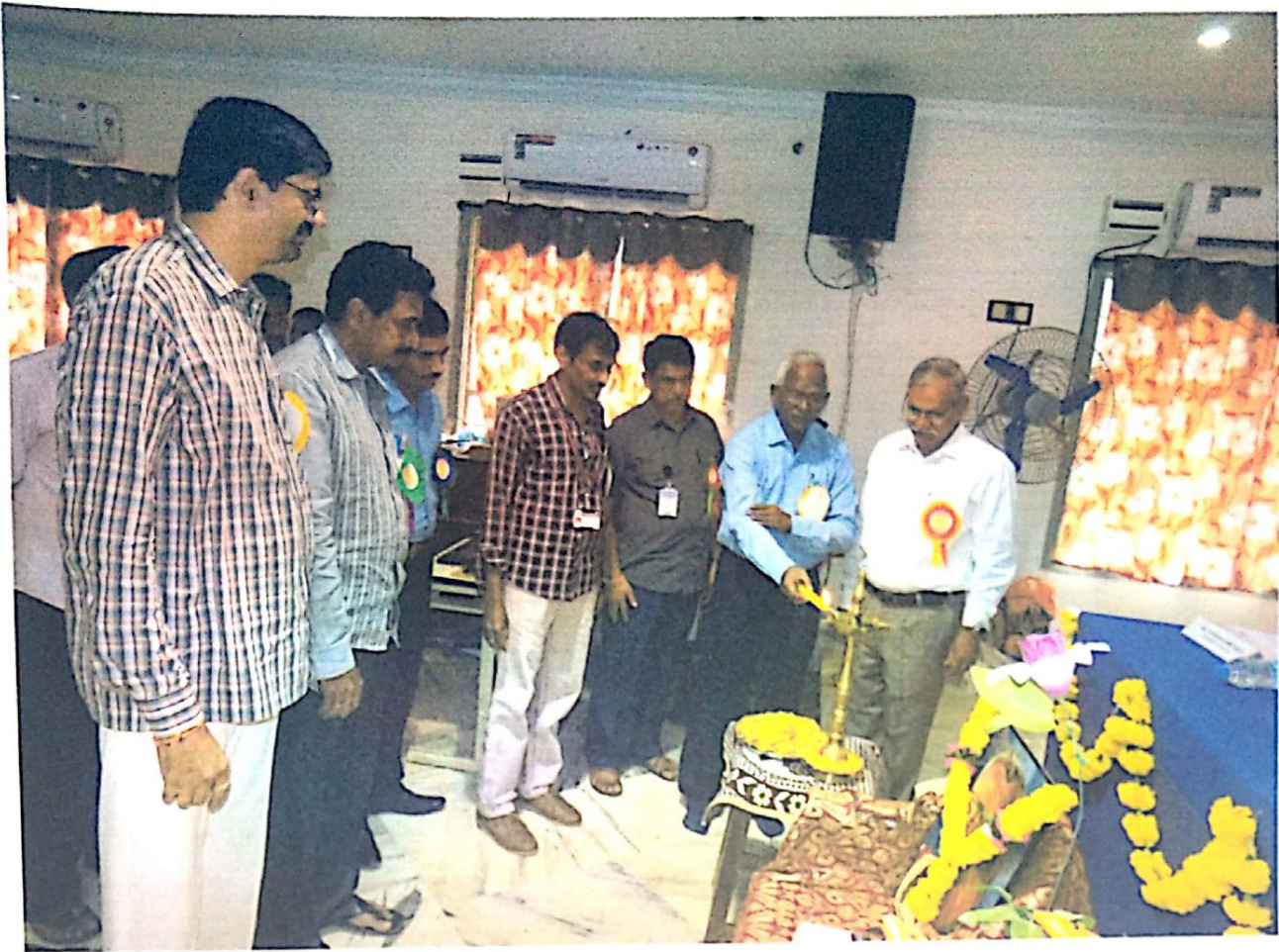
Lighting the Lamp by Dignitaries