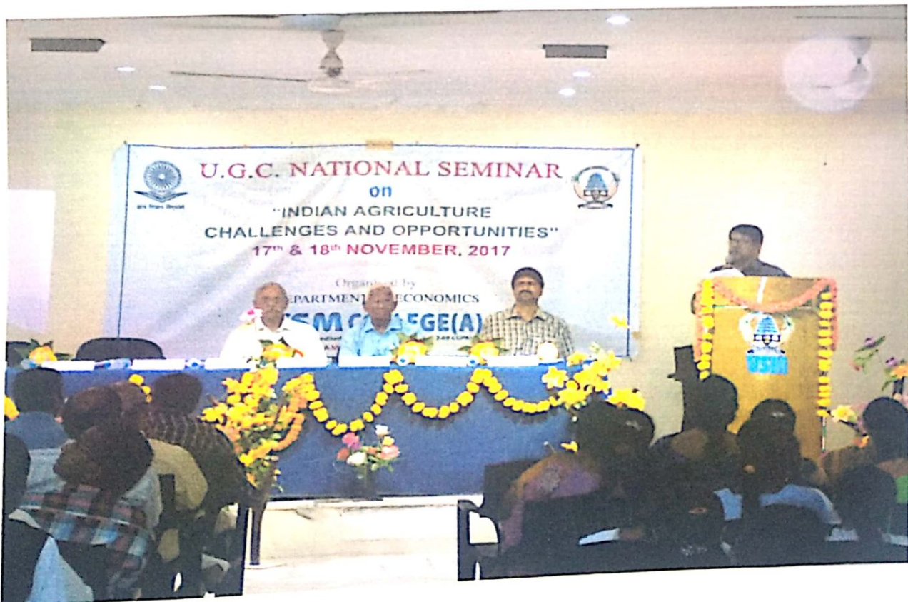
Dignitaries on the dais