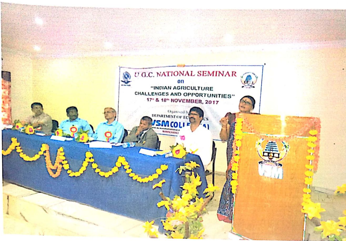
Dignitaries on the dais