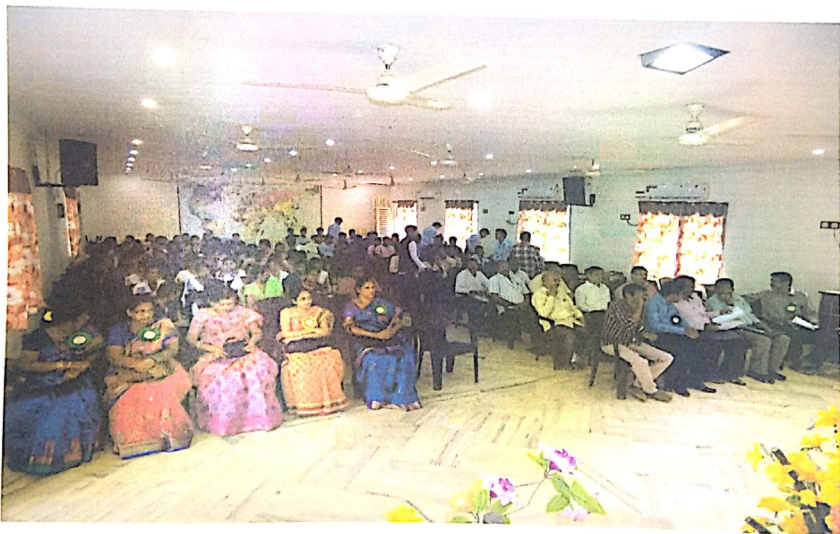
Participants in the Seminar